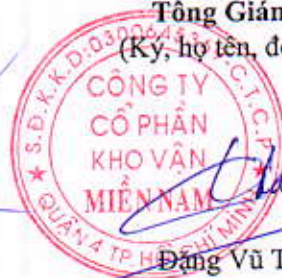
Đặng Vũ Thành